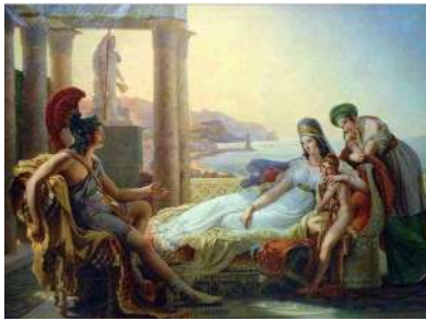
Didon accueillant Enée, Pierre-Narcisse Guérin (1815)