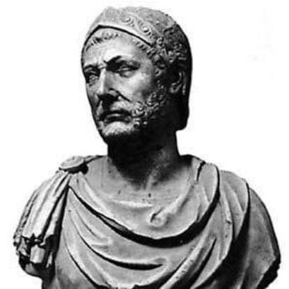
Hannibal Barca (né en -247 et mort vers -182)